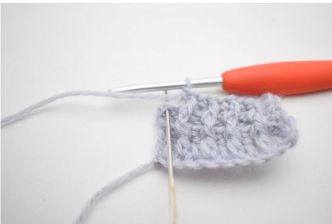
9. Hekle 1 alm stm i siste m.