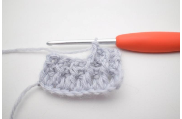
6. "Hekle 1 brstm rundt første m, hekle 1 frstm rundt neste m".