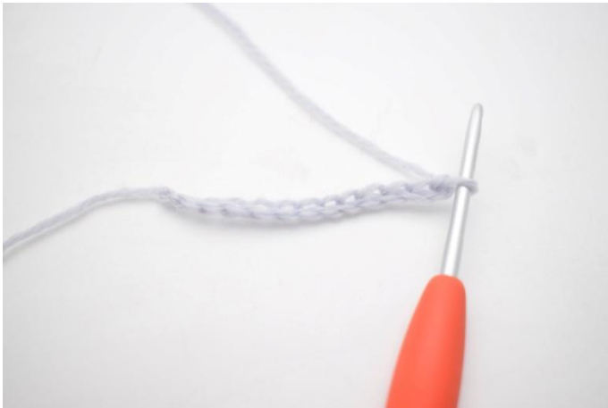
1. Legg opp 25 lm.