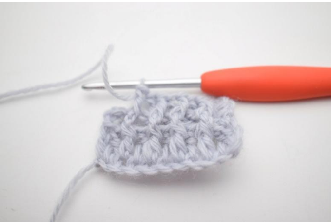
7. Gjenta "til" til du har igjen 2 m.