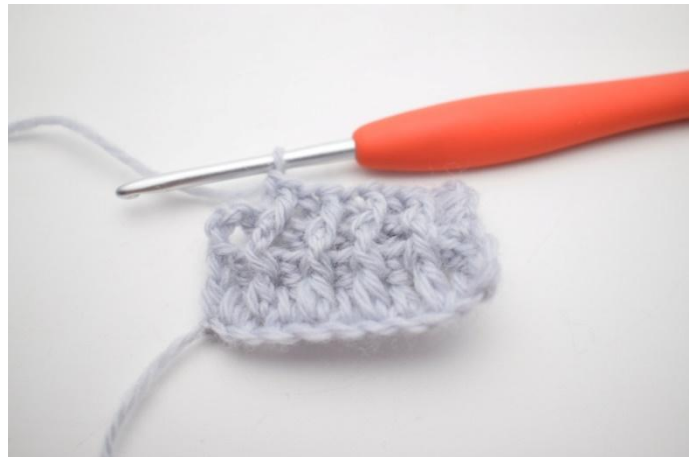
8. Hekle 1 brstm rundt neste m.