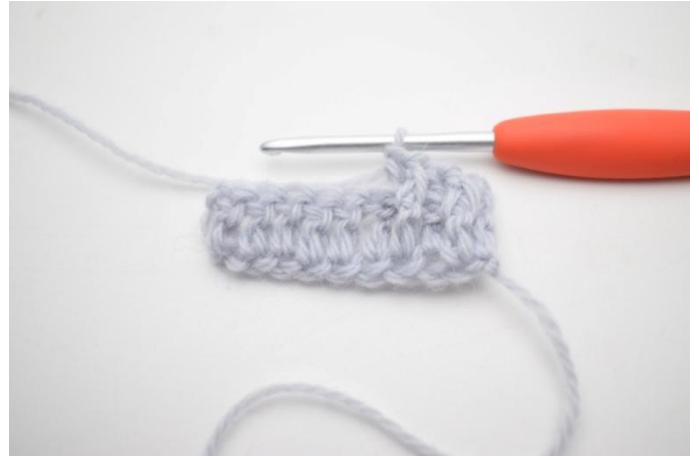
6. "Hekle 1 frstm rundt neste m, hekle 1 brstm rundt den påfølgende m".