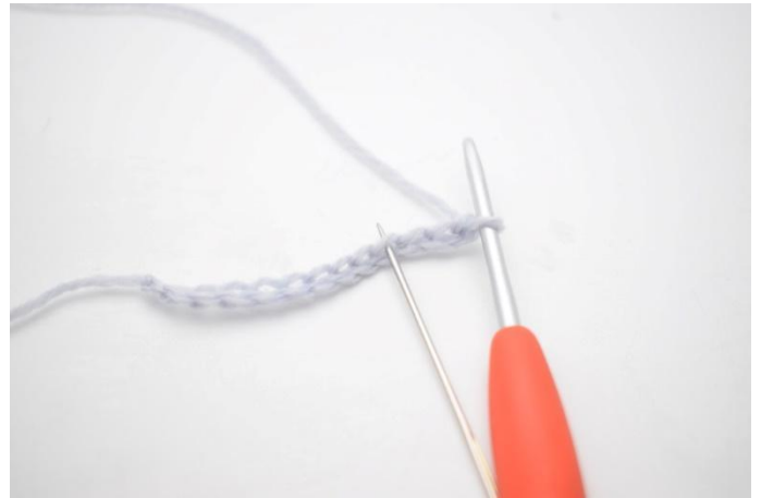
2. Hekle 1 stm i 4. lm fra nålen.