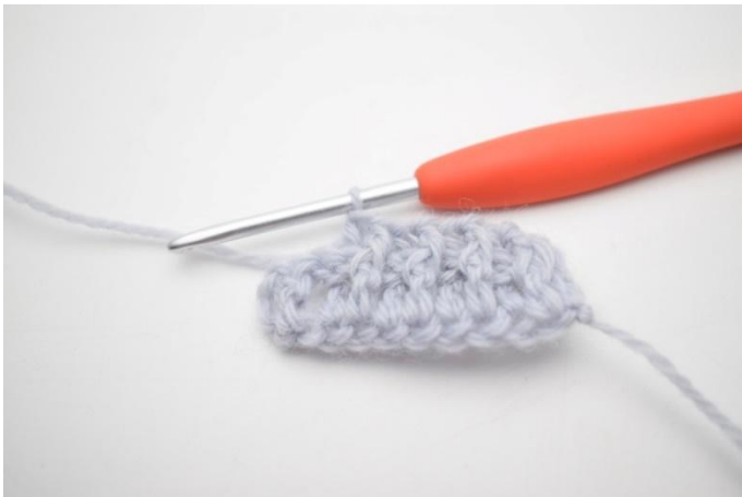
7. Gjenta "til" til du har igjen 2 m.