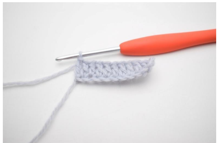
4. Hekle stm ut raden. (23)