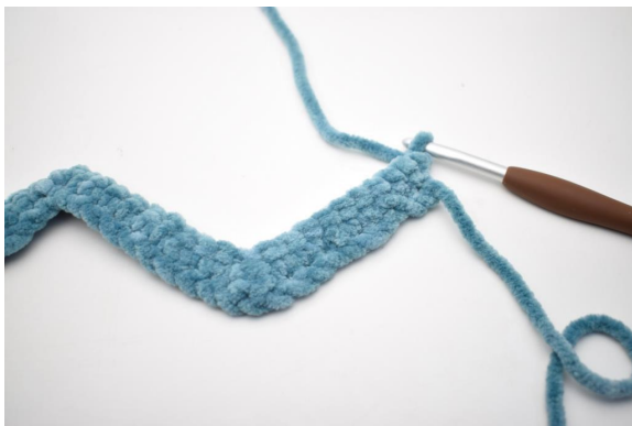
16. Vend med 1 lm.