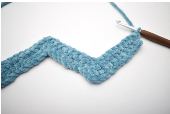
27. Denne raden hekles som rad 2. Vend med 1 lm.