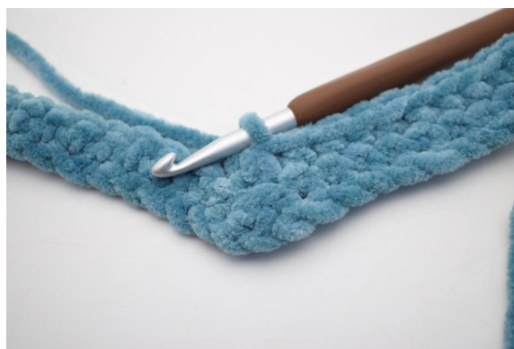
19. Hekle 3 fm sm.