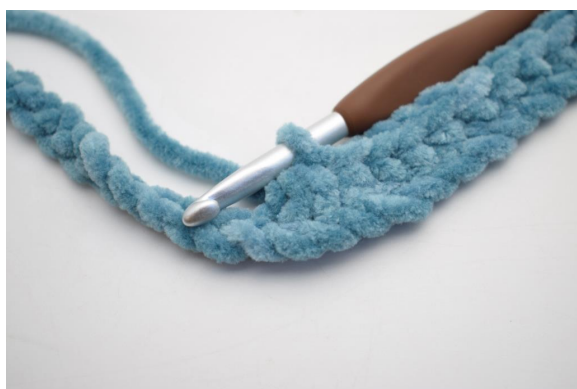
9. Hekle 3 fm sm.