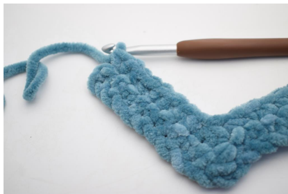
25. Hekle 1 fm i de neste 8 m.