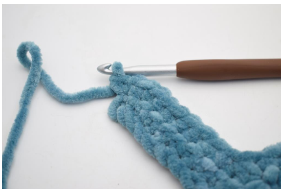
26. Hekle 2 fm i siste m.