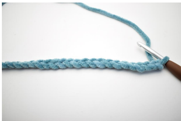
1. Med farge A. Legg opp 62 lm.