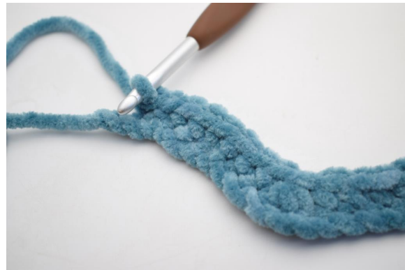
14. Hekle 1 fm i de neste 8 lm.