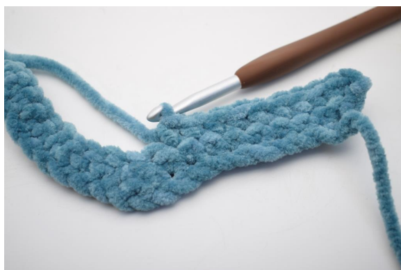
18. "Hekle 1 fm i de neste 8 m.