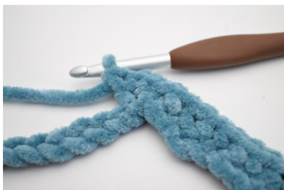
11. Hekle 3 fm i den etterfølgende lm”.