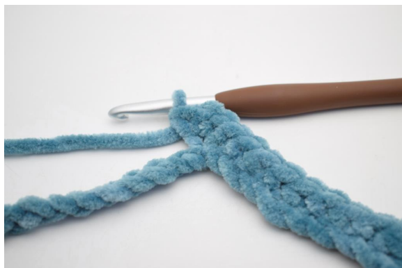
7. Hekle 3 fm i den etterfølgende lm”.