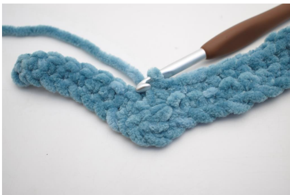
24. Hekle 3 fm sm.