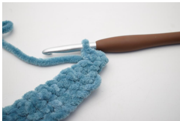
28. Hekle 2 fm i første m.