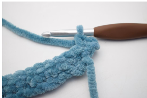
17. Hekle 2 fm i første m.