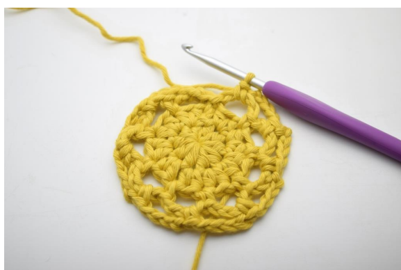
19. Gjenta "til" rundt omgangen.