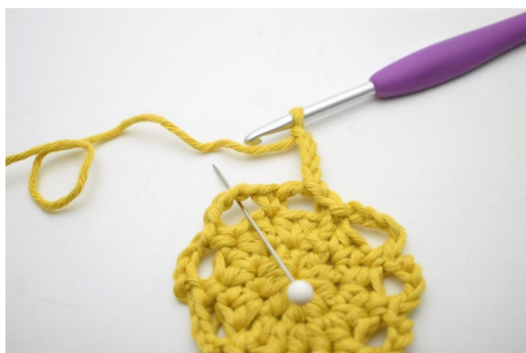
15. "Lag 4 lm, hekle 1 fm i neste lm-bue".