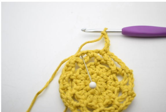
22. "Lag 4 lm, hekle 1 fm i neste lm-bue".