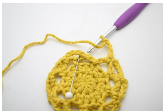
20. Omgangen avsluttes med 1 fm i den første av lm-buene som ble dannet på omgangen.