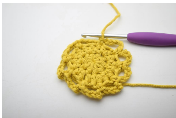
12. Slik. (9 lm-buer)