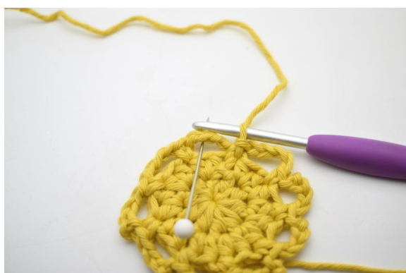
13. Lag 2 km opp langs den første lm-buen så du starter på midten av den.