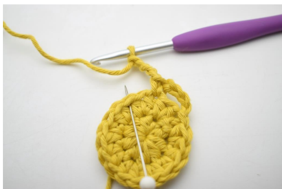
8. Hopp over 1 m og hekle 1 fm i neste m".