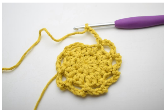
10. Gjenta "til" rundt omgangen.