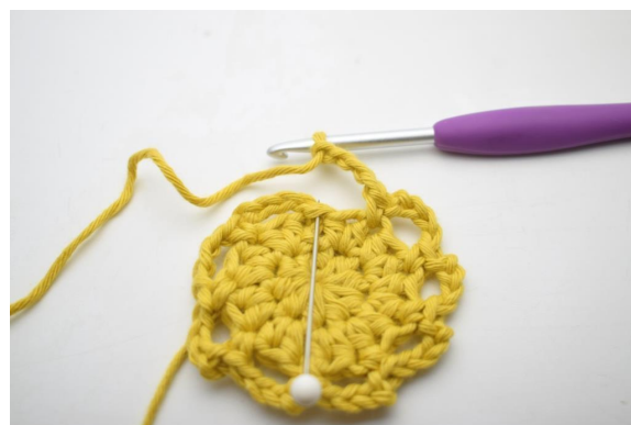
11. Avslutt med 1 km.