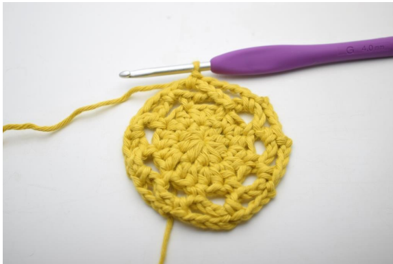
21. Slik. (9 lm-buer)