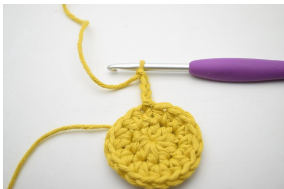
4. "Lag 4 lm.