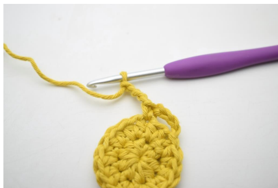
7. "Lag 4 lm.