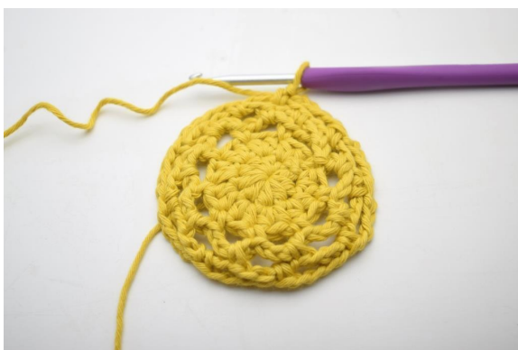
24. Gjenta "til" rundt omgangen. (9 lm-buer)