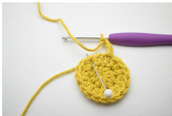
5. Hopp over 1 m og hekle 1 fm i neste m".