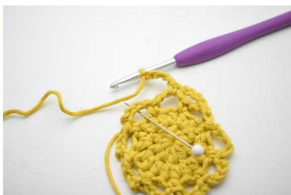
17. "Lag 4 lm, hekle 1 fm i neste lm-bue".