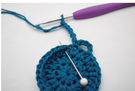
9. Hopp over 1 m og hekle 1 fm i neste m".