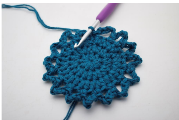
13. Slik. (15 lm-buer)