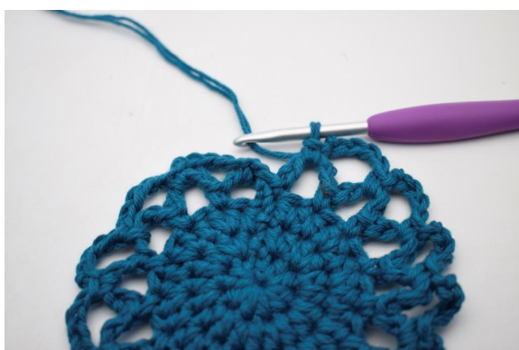
20. Gjenta "til" rundt omgangen.