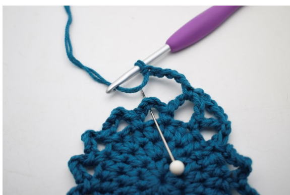
18. "Lag 5 lm, hekle 1 fm i neste lm-bue".