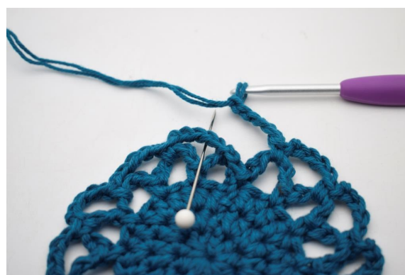
20. Omgangen avsluttes med 1 fm i den første av lm-buene som ble dannet på omgangen.