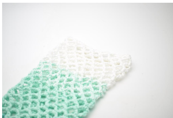
32. Klipp garnet og fest endene.