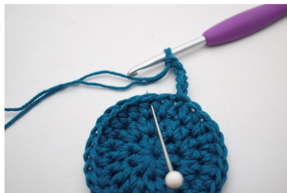
6. Hopp over 1 m og hekle 1 fm i neste m".