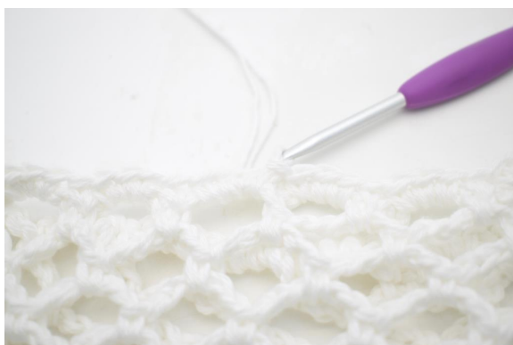
31. Gjenta “til” rundt omgangen. Avlsutt med 1 km.