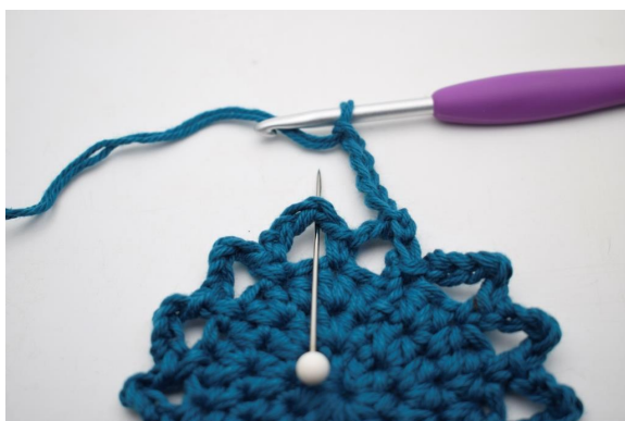
16. "Lag 5 lm, hekle 1 fm i neste lm-bue".