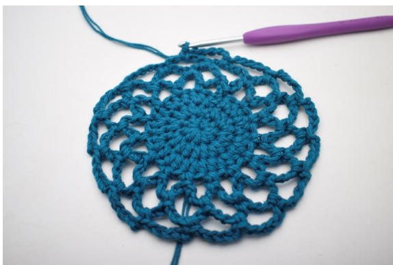
24. Gjenta "til" rundt omgangen. (15 lm-buer)