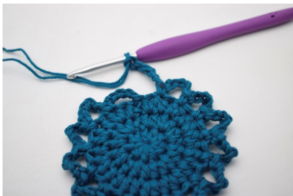
11. "Lag 5 lm, hopp over 1 m og hekle 1 fm i neste m". Gjenta "til" rundt omgangen.