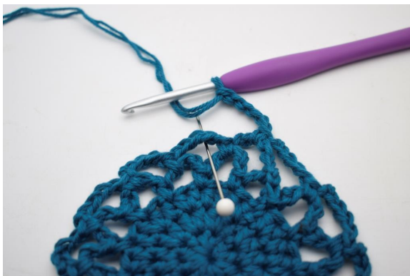
22. "Lag 5 lm, hekle 1 fm i neste lm-bue".