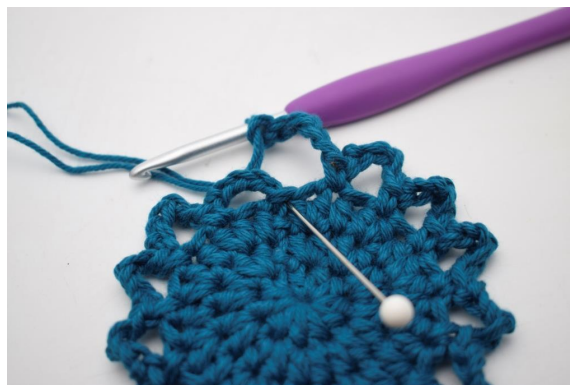
12. Avslutt med 1 km.