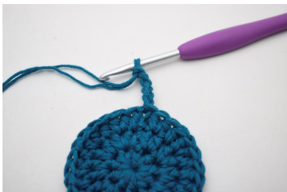
5. "Lag 5 lm.