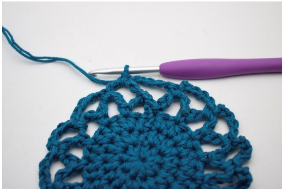
21. Slik. (15 lm-buer)