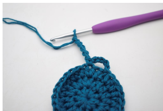
8. "Lag 5 lm.