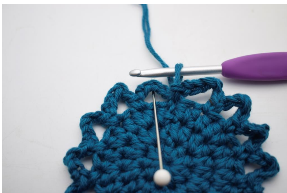
14. Lag 3 km opp langs den første lm-buen så du starter på midten av den.