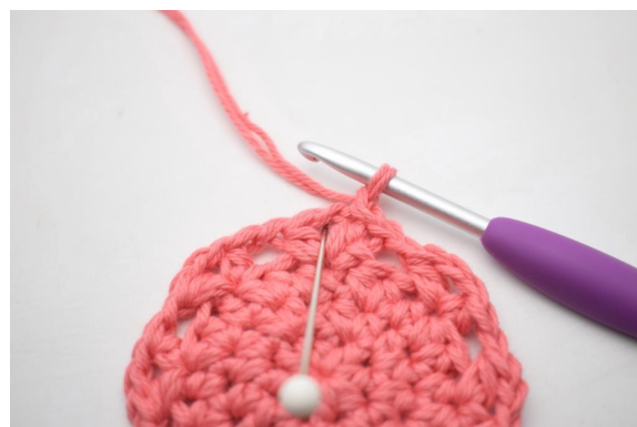
17. "Hekle 4 hstm, 1 lm og 4 hstm i lm-buen".