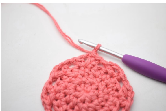
16. Lag 1 lm.