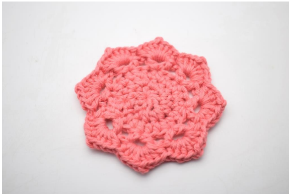
22. Klipp garnet og fest endene.