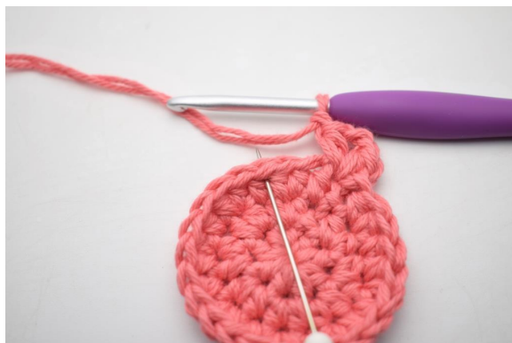
9. “Hopp over 2 m og hekle 1 hstm, 2 lm og 1 hstm i neste m. Lag 1 lm”.