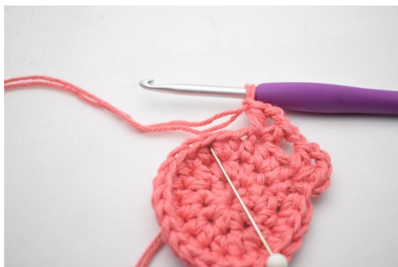
11. “Hopp over 2 m og hekle 1 hstm, 2 lm og 1 hstm i neste m. Lag 1 lm”.