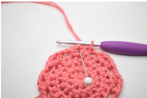
14. Lag km videre til den første lm-buen.