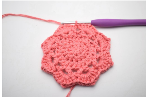
21. Gjenta "til" rundt i alle 8 lm-buene. Avslutt med 1 km.