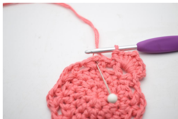
19. "Hekle 4 hstm, 1 lm og 4 hstm i lm-buen".