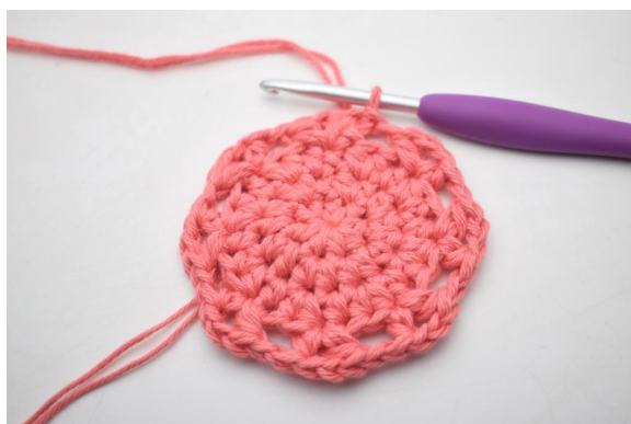
13. Gjenta “til” rundt omgangen. Avslutt med 1 km.