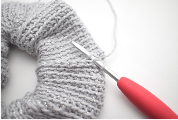
13. Hekle 1 kjm gjennom neste bml og neste ledd i oppleggskanten.