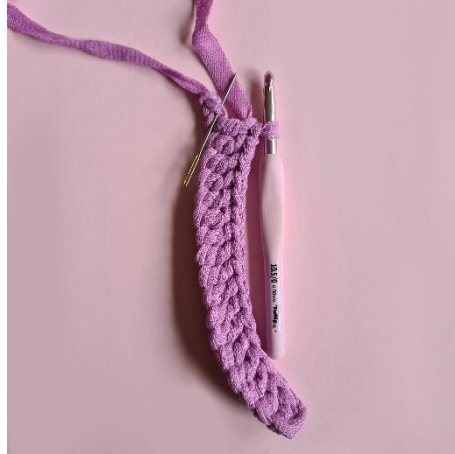
2. 16 stm, 3 stm i samme m