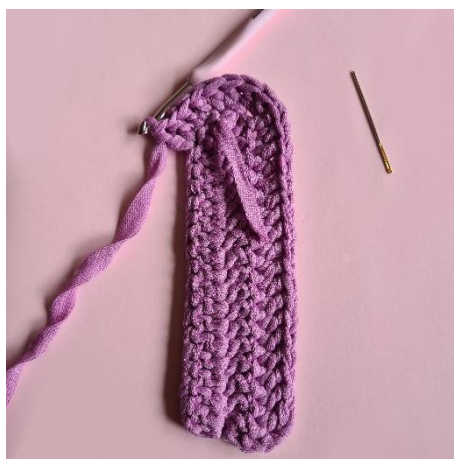
8. [øk] x5,