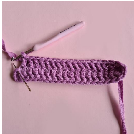
4. 2 stm i siste m.