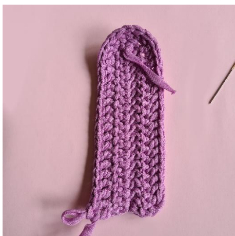
9. 16 stm. 1 st i vlm. Vend