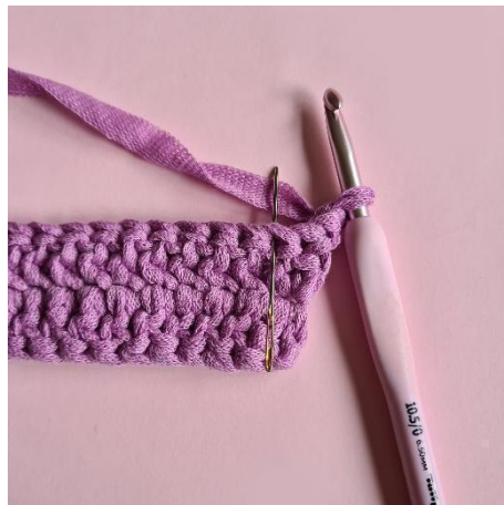
2 lm, hopp over den første m