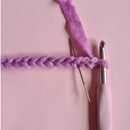
1. Lag 20 lm, start i 3. lm fra nålen