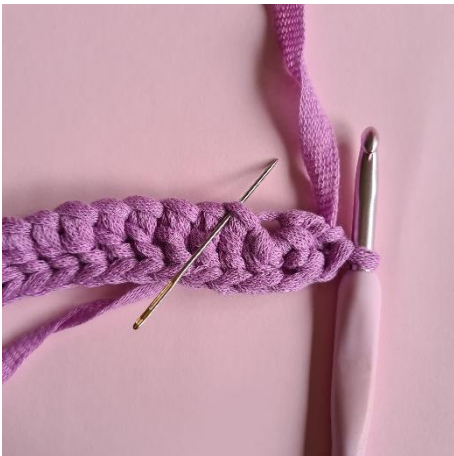
3. vend uten å vende arbeidet. 16 stm.