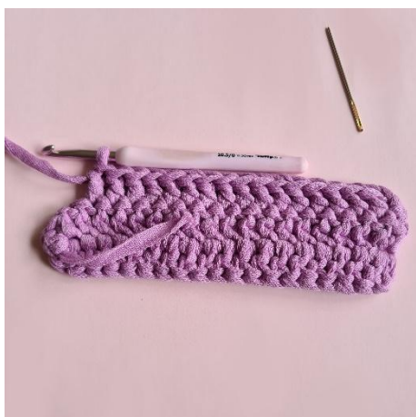
7. 16 stm.