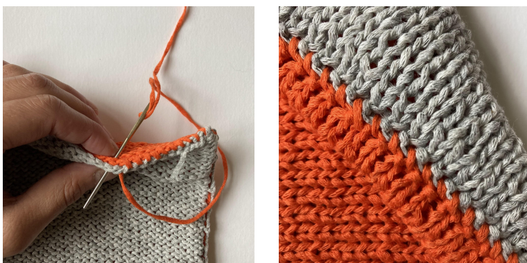
Bilder: Sammensying av bunn, Ferdig sammensying sett fra rettsiden

Deretter vendes arbeidet på vrangen og bunnen syes sammen.