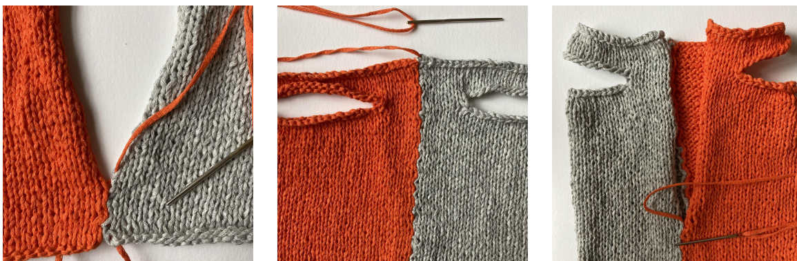
Bilder: Sammensying av sider

Først syes sidesømmene sammen med madrassting (arbeidet syes sammen fra rettsiden med arbeidet liggende ved siden av hverandre).