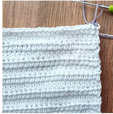
1 lm, [fm, 2 lm, fm] i samme m