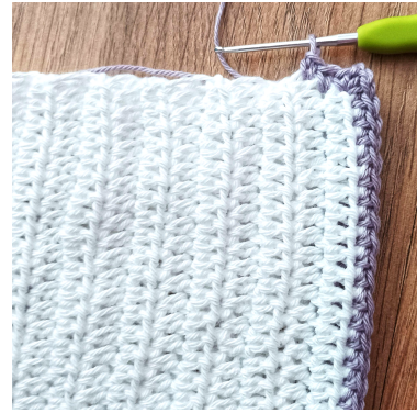
Fm rundt baksiden av kysen