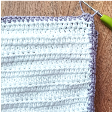
Kjm i de første m