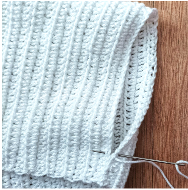
Sy kysen fra innsiden