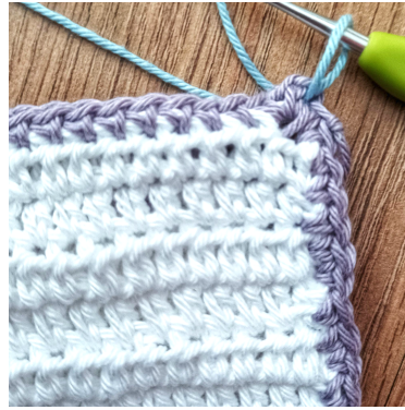
Legg til en ny farge i 2 luftmaske-buen