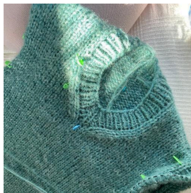
Ribb i v-halsen