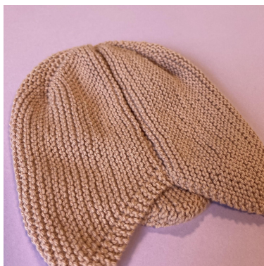
Sy oppleggskanten sammen med felle kanten.