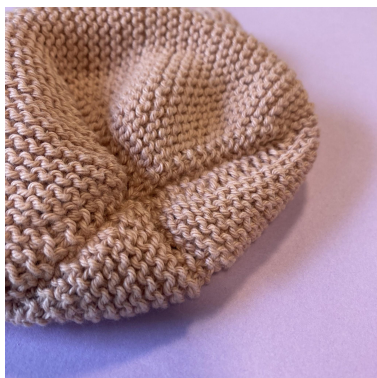
Sammensyning del 1-6