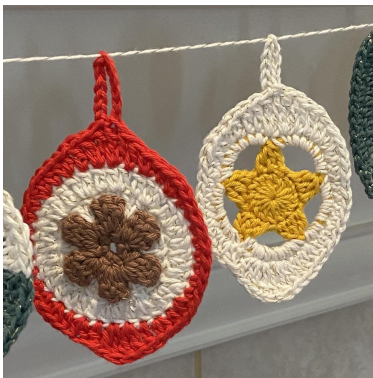
Popcorn og Stjerne

Omg 4: 3 lm, 2 st, [2 dblst], [2 dblst], 3 st, [2 hst], hst, 6 fm, 3 hst, [2 hst], 3 st, [2 dblst], [dblst], 10 lm, kjm i dblst, dblst, 3 st, [2 hst], 3 hst, 6 fm, hst, [2 hst], kjm i toppen a 3 lm, klipp tråden (48 m + 10-lm-bue).