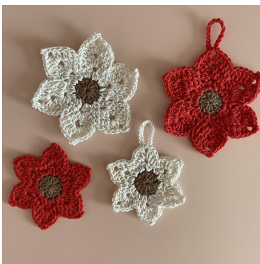
Stor og liten Julestjerne

Omg 3: 1 1m (teller som første fm), st. I 3-1m-buen [2 st, 15 1m, fm i første 1m av 15 1m, 2 st], st, fm. {Fm, st, i 3-1m-buen [2 st, 3 1m, fm i første 1m av 3 1m, 2 st], st, fm}. Gjenta { } 4 ganger til. Kjm i 1 1m, klipp tråden. (48 m + 6 1m-buer).