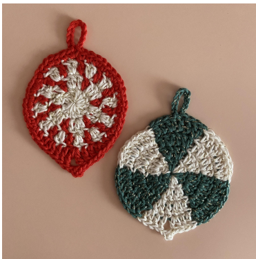
Peppermynthe og Grønn Virvel

Omg 4: [2 lm (teller som første hst hele veien), hst]. 2 st, [dblst, 3 lm, fm i første lm, dblst]. 2 st, [2 hst], 2 hst, {[2 fm], 2 fm}, gjenta { } 3 ganger til, [fm, 10 lm, kjm i fm, fm], 2 fm, gjenta { } 3 ganger til, [2 fm], 2 hst. Hekle en kjm i toppen av de 2 lm, klipp tråden (48 m og 2 lm-buer).