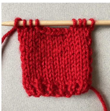
Avmaskning av hals på forstykke

Fell av til hals: Strikk 4 m, fell av 6 m, strikk 4 m