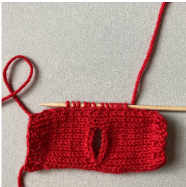
Opp-plukking av masker til erme