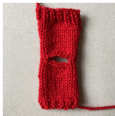
Ferdig for- og bakstykke