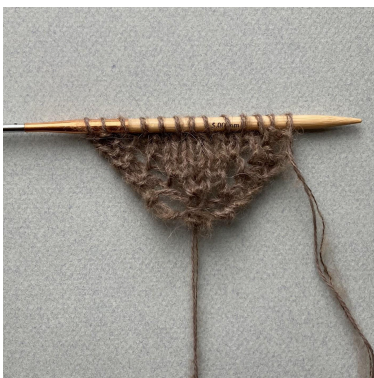
Begynnelsen av bandanaen

Gjenta *-* 3 ganger til = 13 m på pinnen