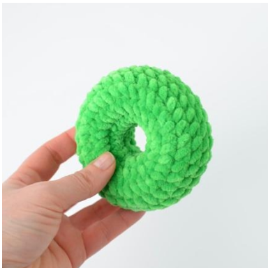
5. Ferdig ring