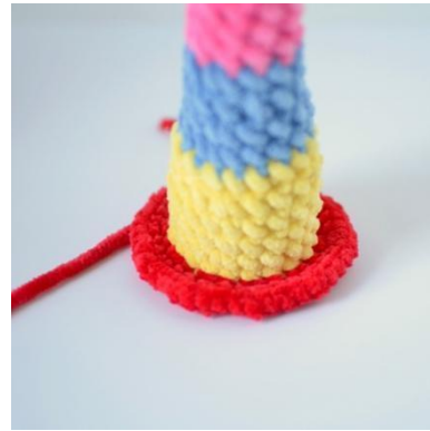
18. Hekle i fremre maskebue