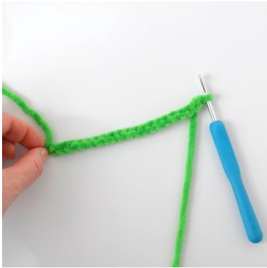
1. Legg opp luftmaskene