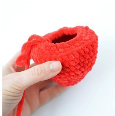
6. Hekle i bakre maskebue for å gjøre bunnen flat