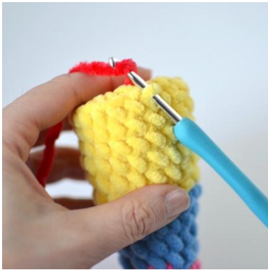
17. Hekle i fremre maskebue