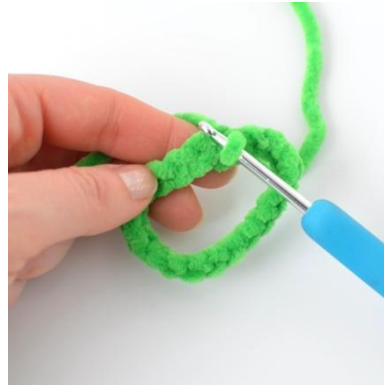
2. Fest første og siste maske sammen