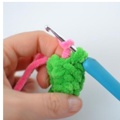
14. Fullfør fm med den nye fargen