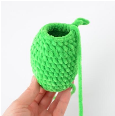
3. Alle omgangene er ferdig