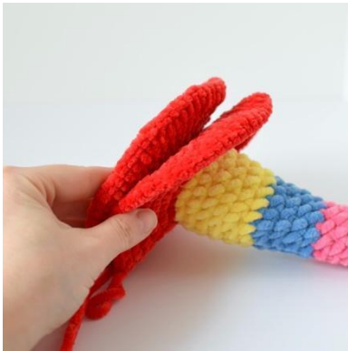
19. Sett plattformen opp på den nedre delen av stangen