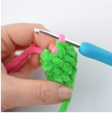
15. Endre farge