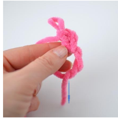
8. Begynn med en magisk ring