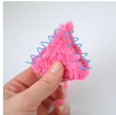
12. Sy sammen sidene på trekanten