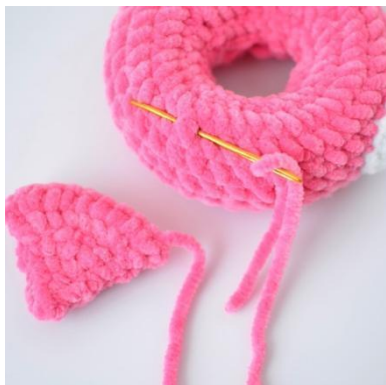
13. Sy fast vingen på ringen