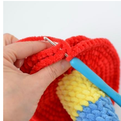
20. Hekle sammen delene med kjm.