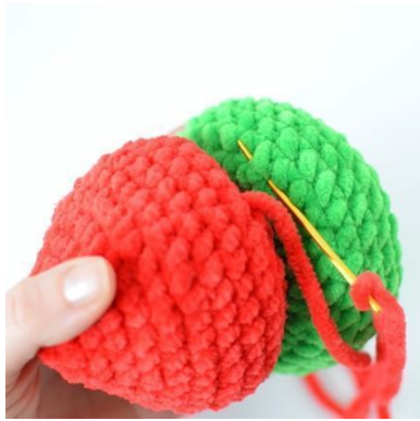
7. Sy fremre maskebue til ringen