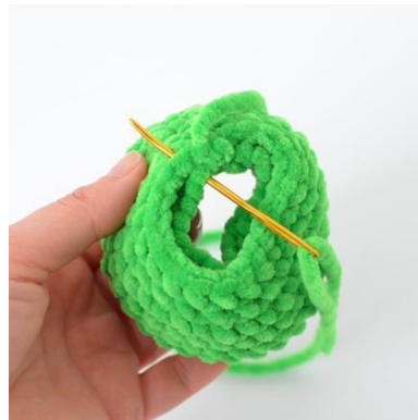
4. Sy sammen første og siste omgang