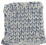
Cosy: Off White SBF: Jeans Blue