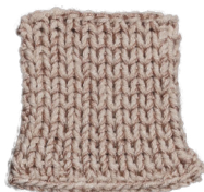
Cosy: Pastel Brown SBF: Nude Beige