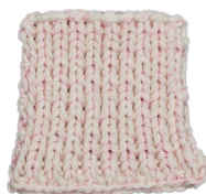
Cosy: Off White SBF: Light Pink