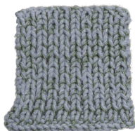
Cosy: Sky Blue SBF: Soft Green