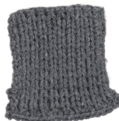
Cosy: Grey SBF: Grey