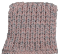
Cosy: Pastel Rose SBF: Light Grey