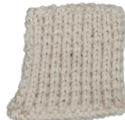
Cosy: Off White SBF: Off White