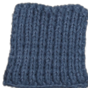
Cosy: Jeans Blue SBF: Jeans Blue