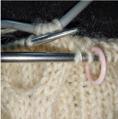
Sno x m bak