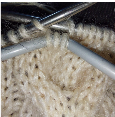
Sno x m foran